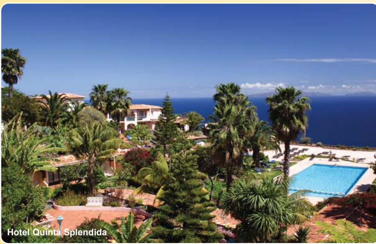
Hotel Quinta Splendida

ERLEBEN Sie die vielfältigen Gesichter und Gärten der Insel des ewigen Frühlings. Aufgrund des milden Klimas ist die Insel ein ganzjährig blühender Garten. GENIESSEN Sie Ihren Urlaub im außergewöhnlichen Hotel Quinta Splendida****, das in einem 30.000 m 2 großen botanischen Garten mit über 1.000 Pflanzen liegt. ENTSPANNEN Sie sich im beheizten Pool mit atemberaubendem Blick auf den Atlantik oder im Wellness-Bereich des Hotels, der zu den schönsten Madeiras zählt.